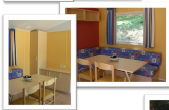
Table avec 2 chaises