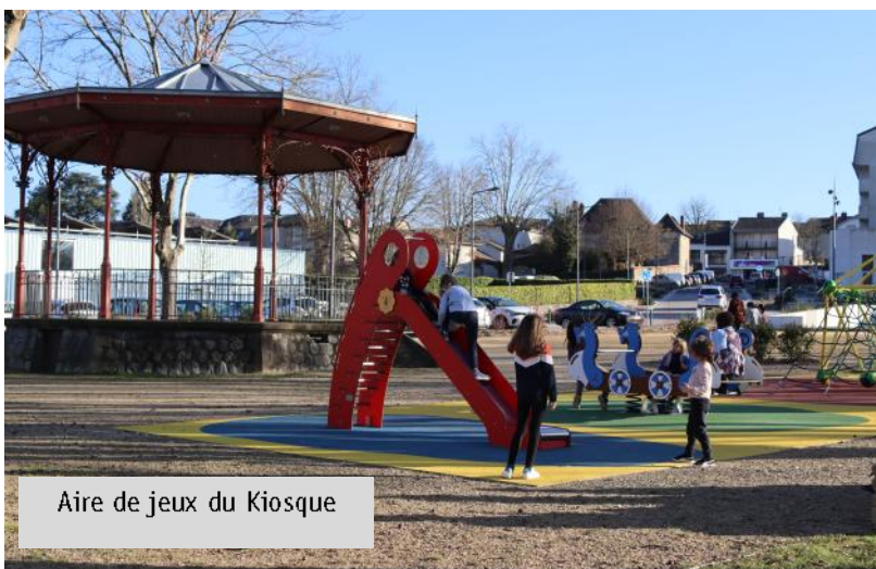
Aire de jeux du Kiosque