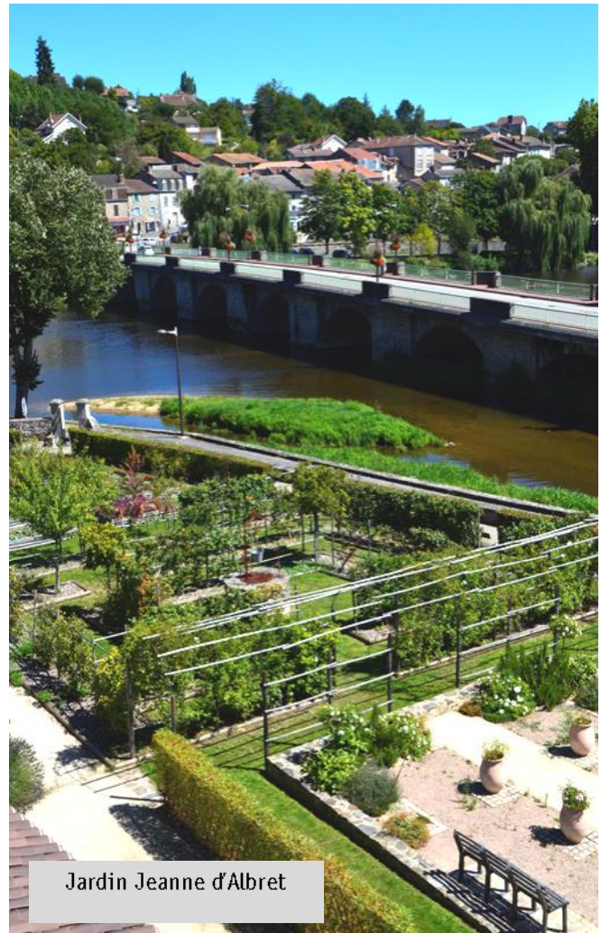
Jardin Jeanne d'Albret