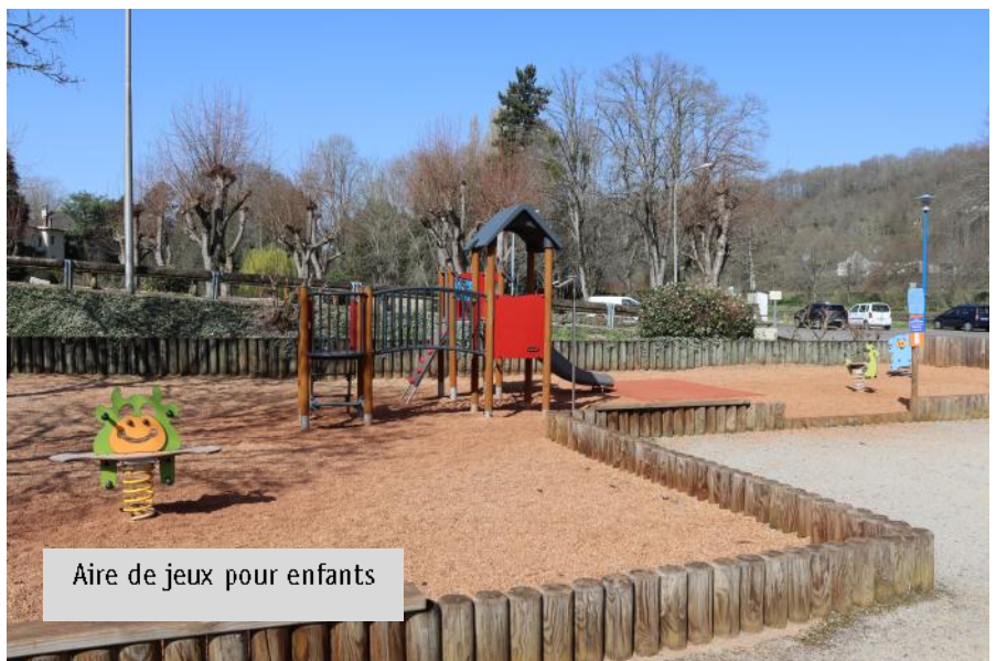
Aire de jeux pour enfants